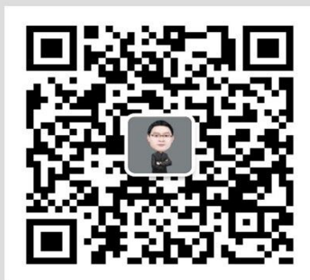
史学庆名师团微信