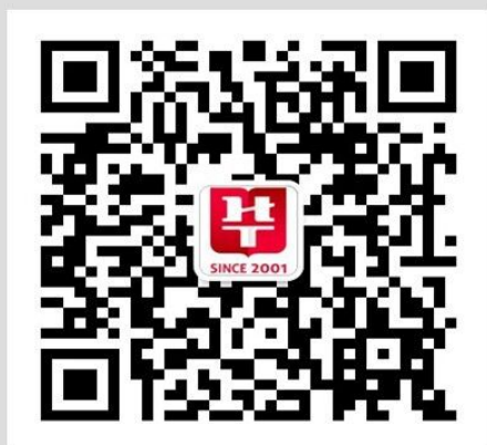
湖北华图官方微信